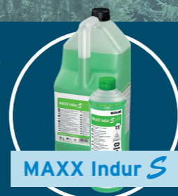
MAXX Indur S