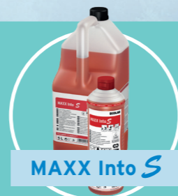
MAXX Into S