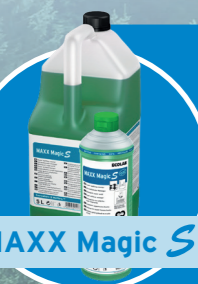
MAXX Magic S