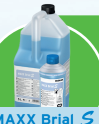
MAXX Brial S